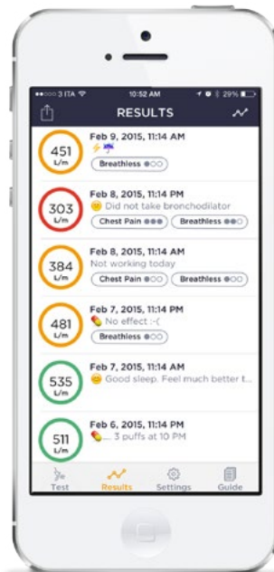
Indicador de saúde com semáforo, pontuação de sintomas e notas